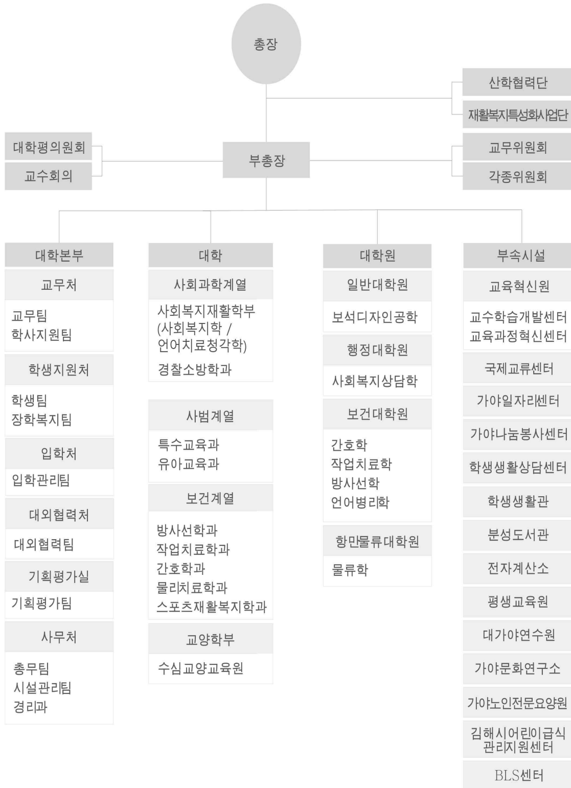
[그림 Ⅱ-2] 행정조직 및 기구표