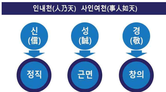
[그림 Ⅱ-1] 건학이념과 건학정신